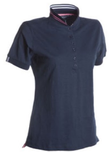
BIANCO/BLU NAVY- BIANCO/FUXIA FLUO RED PASSION/CO-GIALLO FLUO