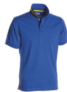
BLU ROYAL/GIALLO-BLU NAVY